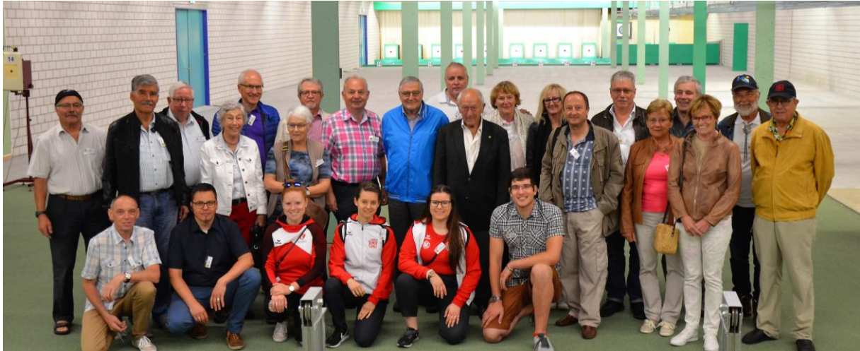
Die Ausflügler in der 50m Schiesshalle.

In den Untergrund des Brünig Parks führte das Jahrestreffen des 100er-Clubs der Gönnervereinigung der Schützennationalmannschaften. Die 28 Teilnehmenden waren vor allem von den Übungsanlagen für die Feuerwehren aus der ganzen Welt fasziniert.